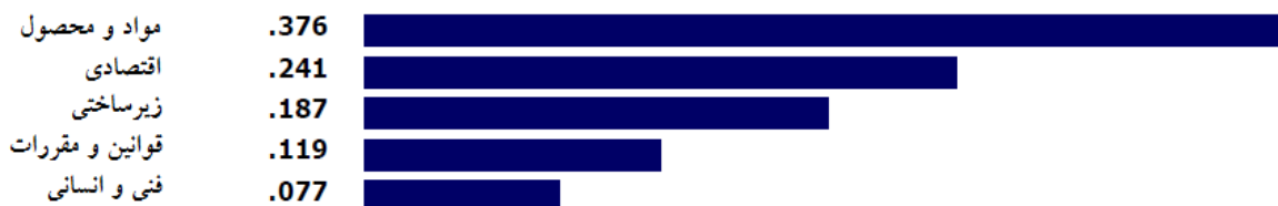
شکل ۲- میانگین هندسی ماتریس مقایسه‌های زوجی و اولویت‌بندی شاخص‌های اصلی مکان‌یابی کارخانه تولید کاغذ کنگره‌ای با کاربرد پسماندهای کشاورزی در استان مازندران (نرخ ناسازگاری = ۰/۰۴)